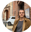
Lucas Meheux Agence française des chemins de Compostelle