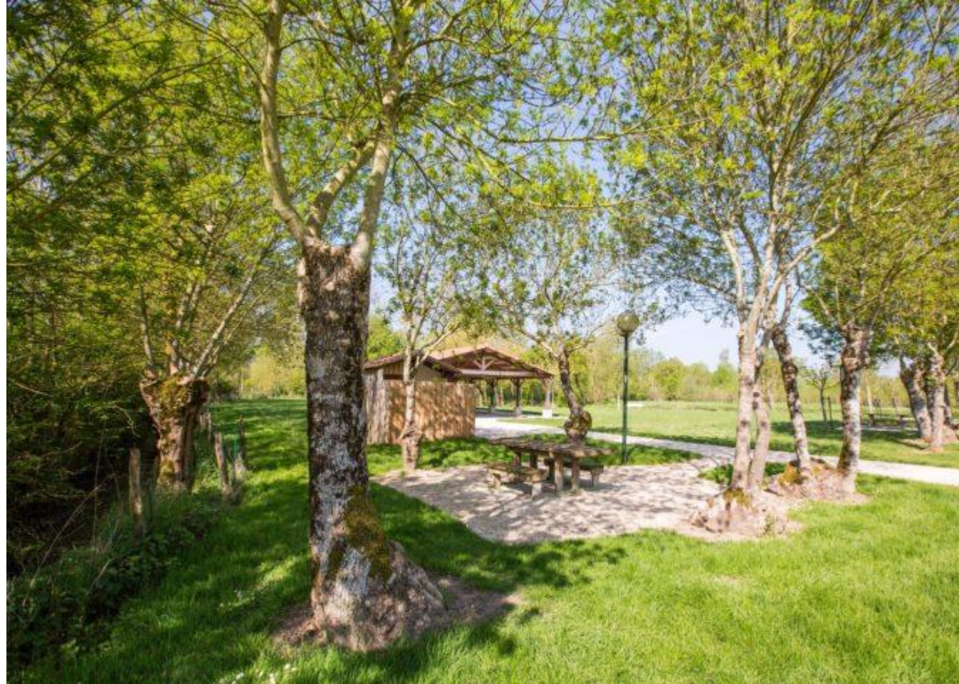
Aire de pique-nique

Mieux équiper un réseau cyclable : la Vendée avance Article d'octobre 2019